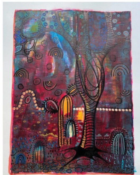
RENIALA - ACRYLIQUE SUR PAPIER 70x50 CM

La peinture de Christine Puechbroussou est un récit de voyages tant réels que spirituels. Ses toiles créent du lien, vibrent d'une énergie particulière qui invite à d'autres voyages, ceux de notre monde intérieur, plus intime. Ces peintures nous ouvrent les portes de l'inconscient et font du bien à ceux qui les regardent.