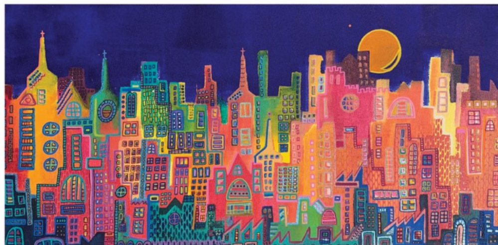
ESPOIR & PATIENCE (DE JOUR) - ACRYLIQUE SUR TOILE 30x60 CM